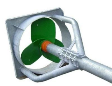
Vleugel + onderstuk